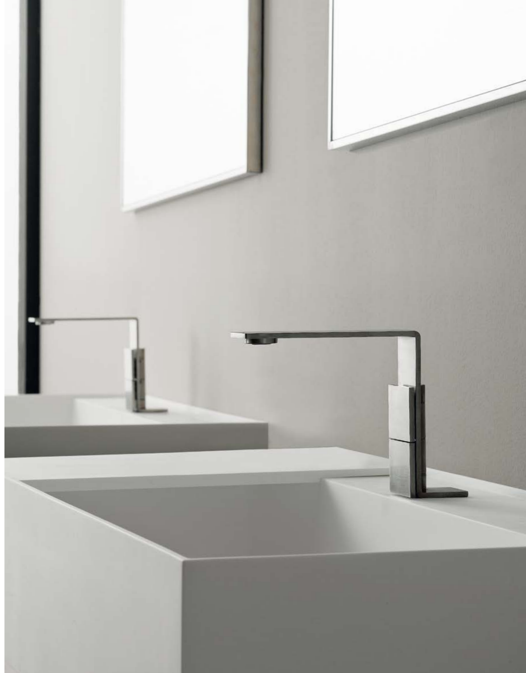
IT 2514 IS 5F ZZ