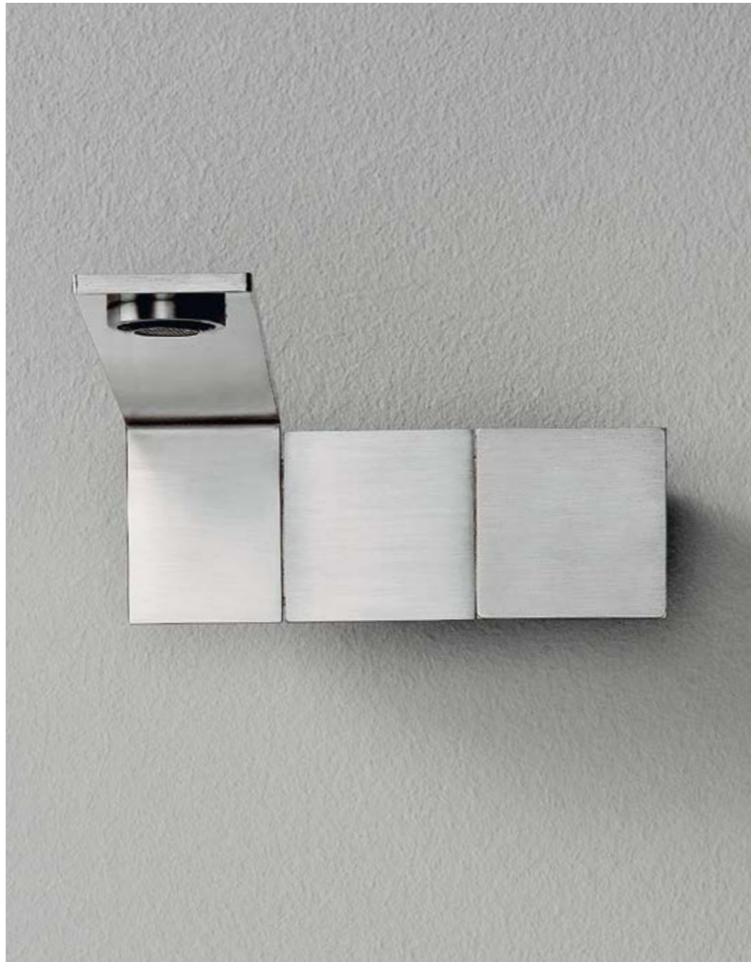
RWIT 2851 IS 96