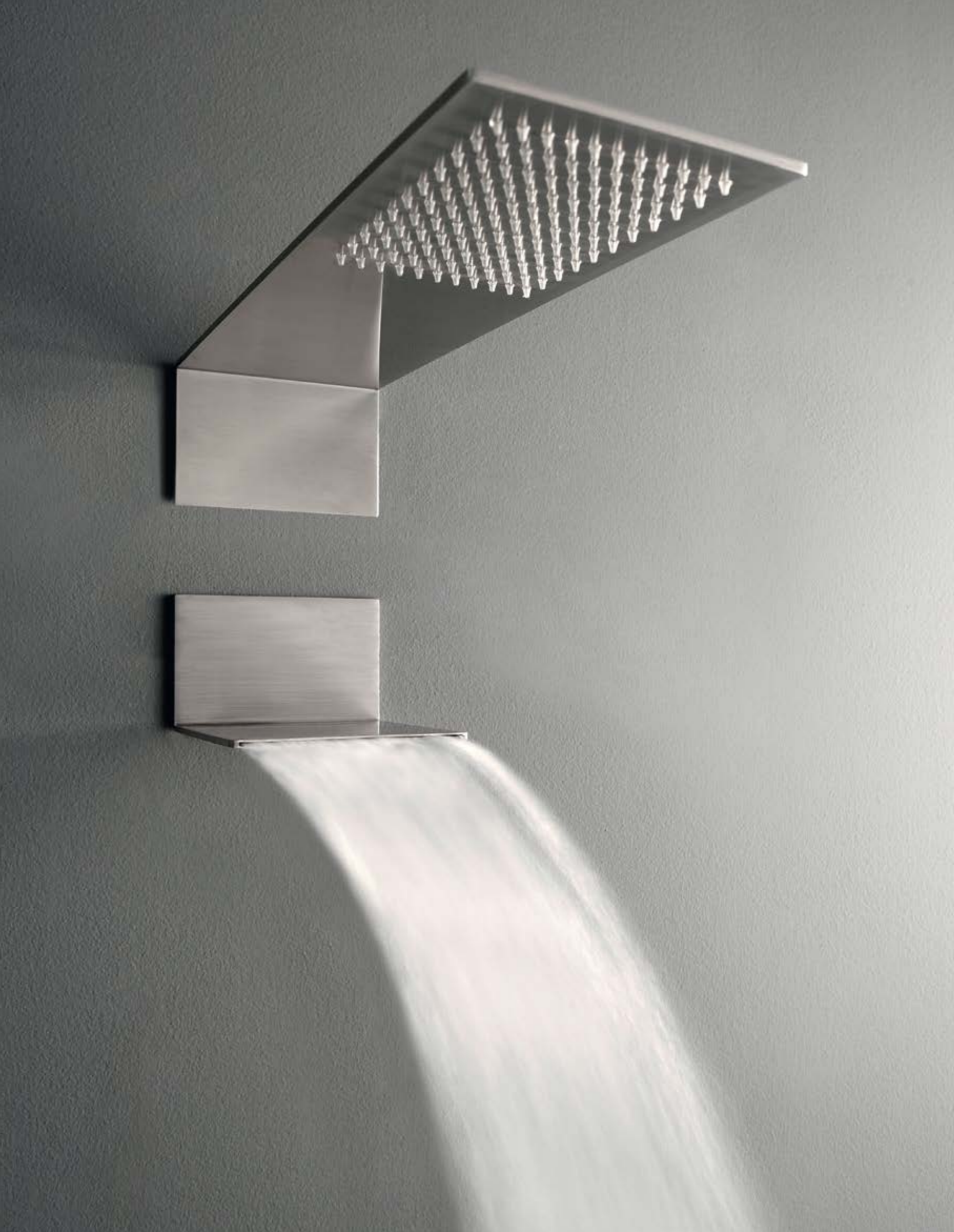
RWIT 2847 IS 01 + RWIT 2847 IS 21