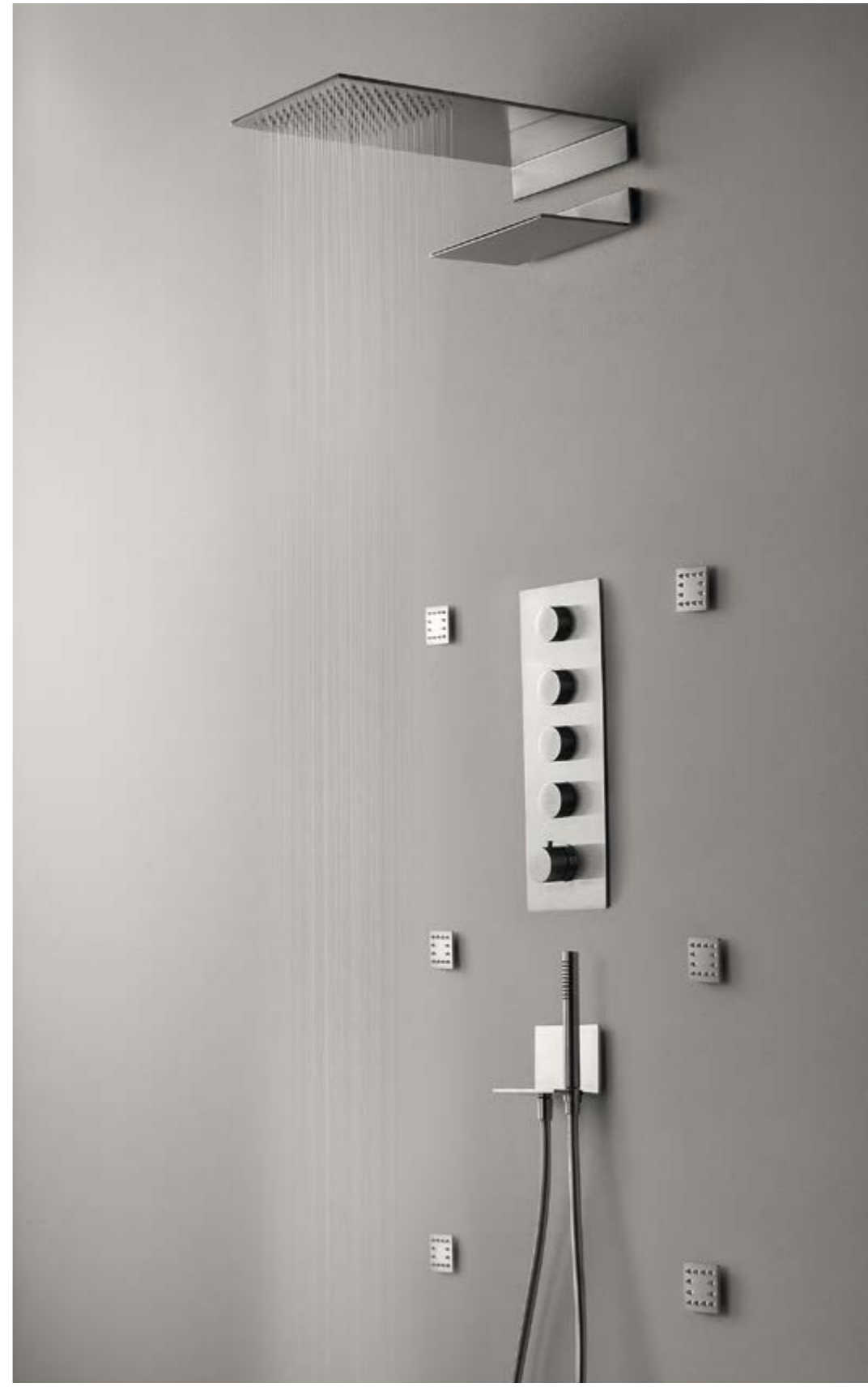
RWIT 2847 IS 52 + RWIT 2597 IS 31 + RWIT 2847 IS 72 + IT RTBR 255 IS x 6