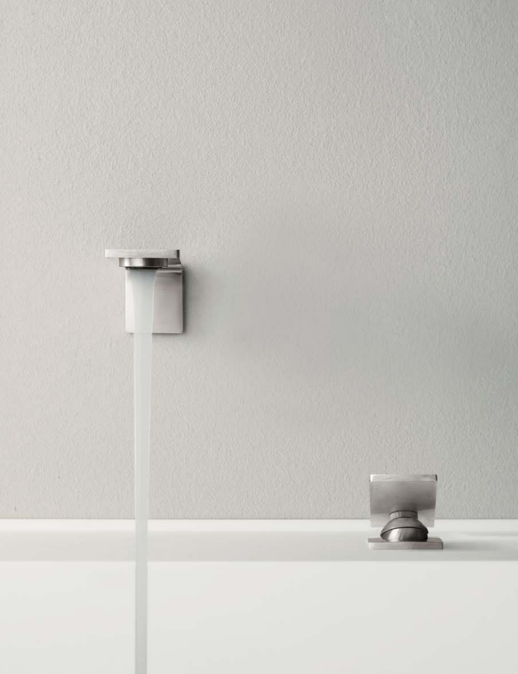
IT 2861 IS ZZ ZZ + RWIT 2865 IS 01