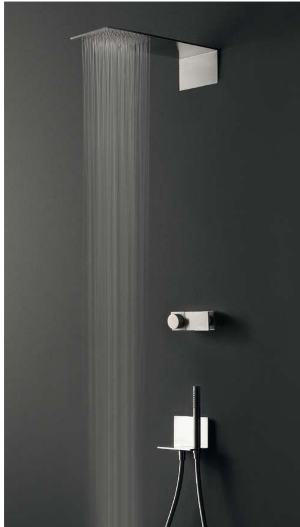
RWIT 2847 IS 01 + RWIT 2849 IS 96 + RWIT 2847 IS 72