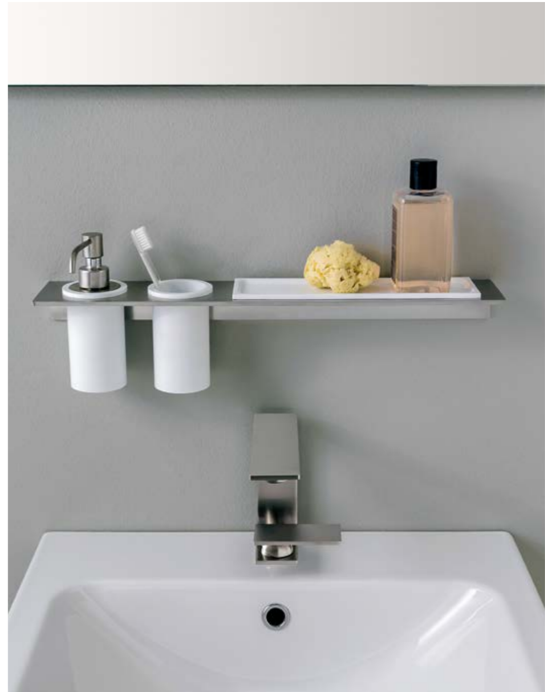
IT 9074 IS ZZ ZZ