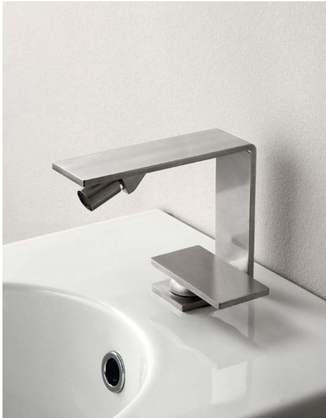
IT 2822 IS 5M ZZ