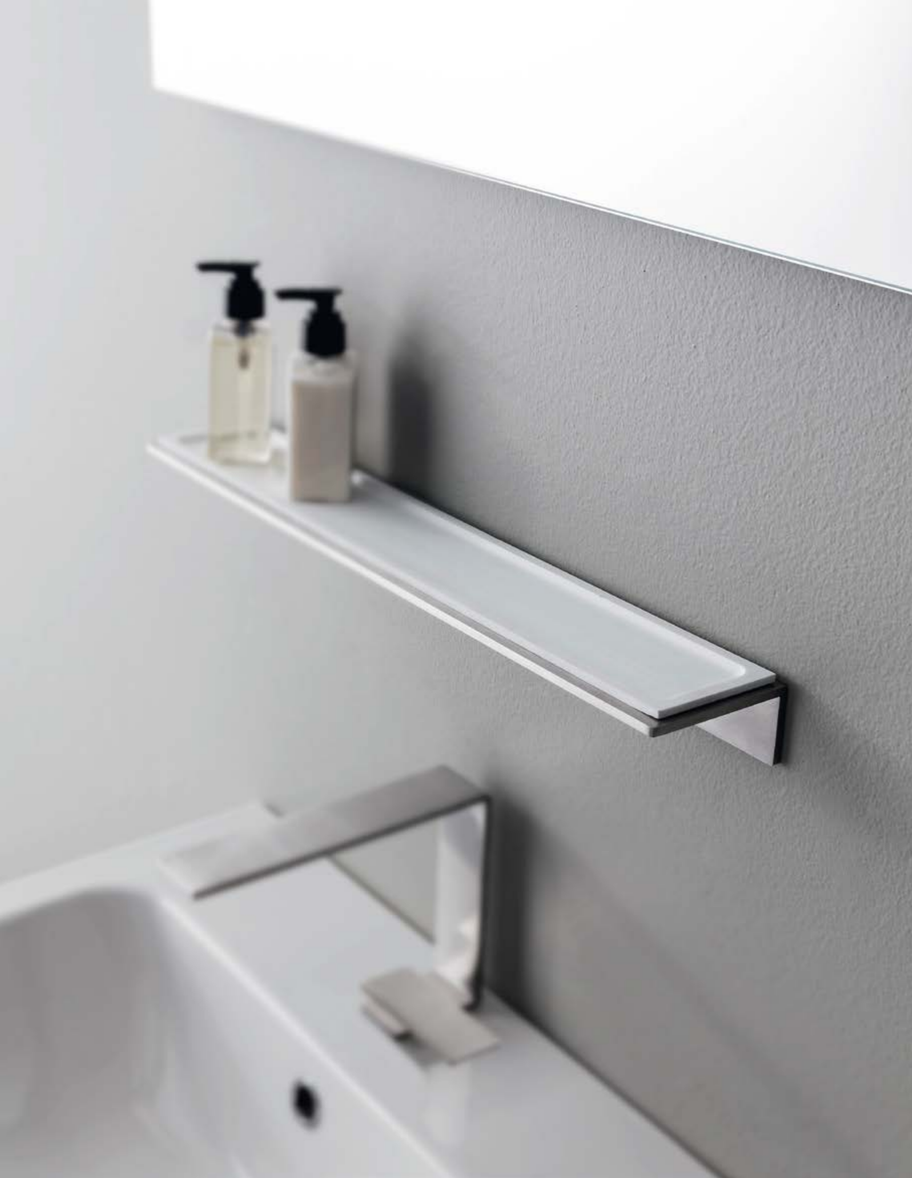
IT 9026 IS ZZ ZZ