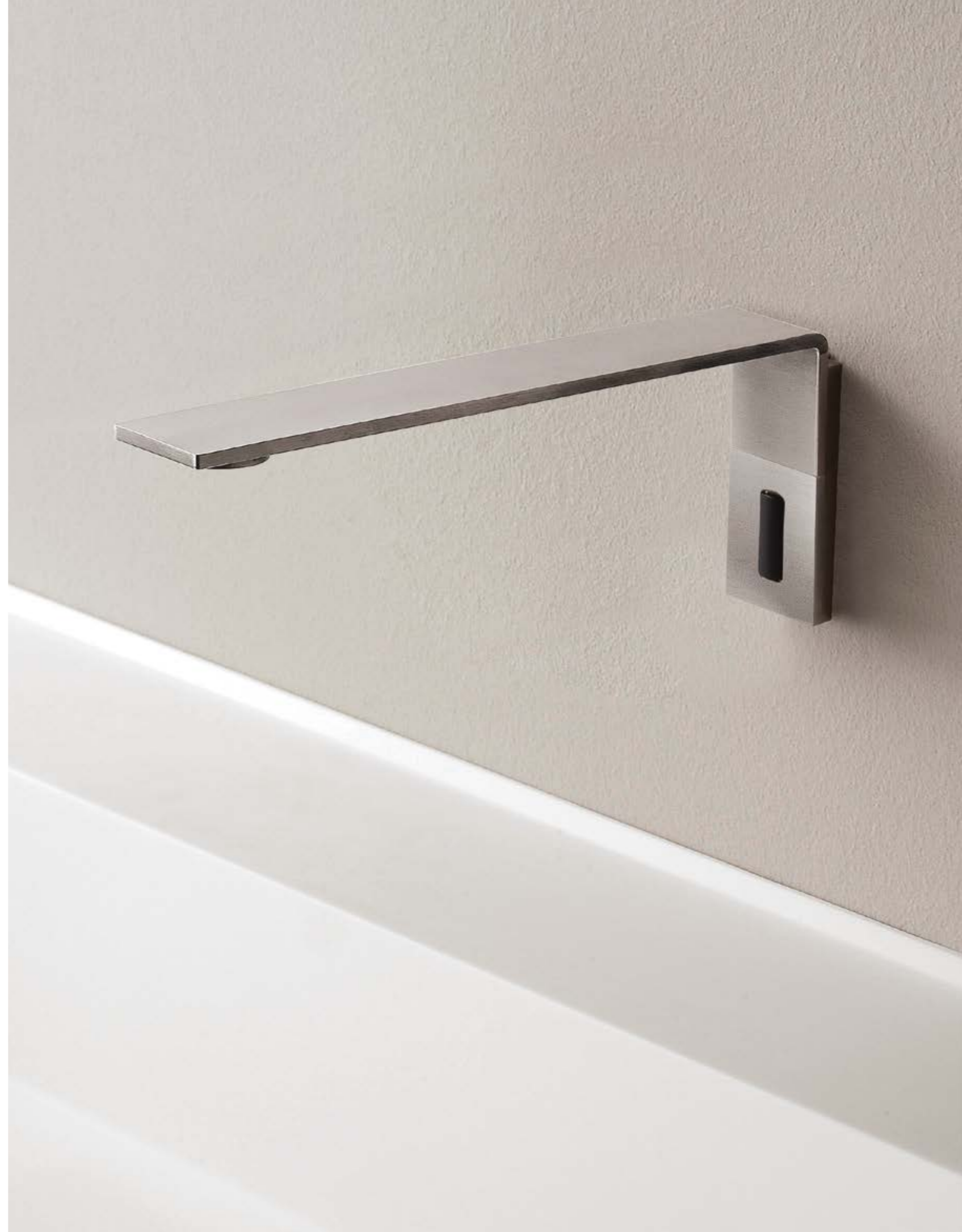
RWIT 2896 IS 02